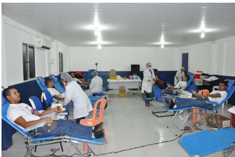
Figura 4: Ação de Responsabilidade Social.