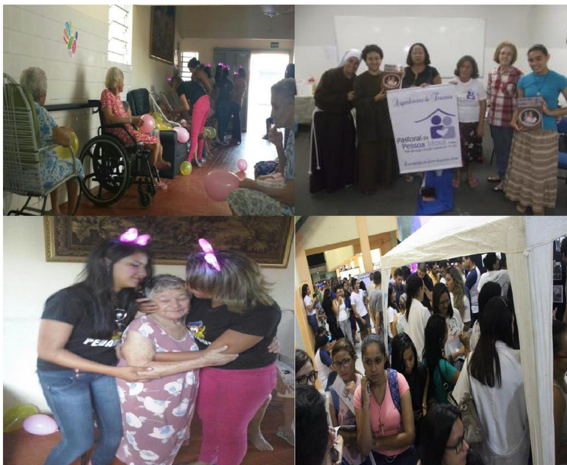
Figuras 5: Sociedade e alunos. Atividades de Responsabilidade Social.