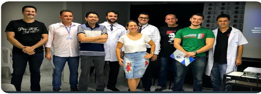
Figura 3: Ação de Responsabilidade Social.