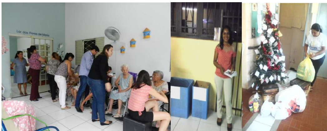
Figura 2: Distribuição de alimentos em abrigo para Idosos.