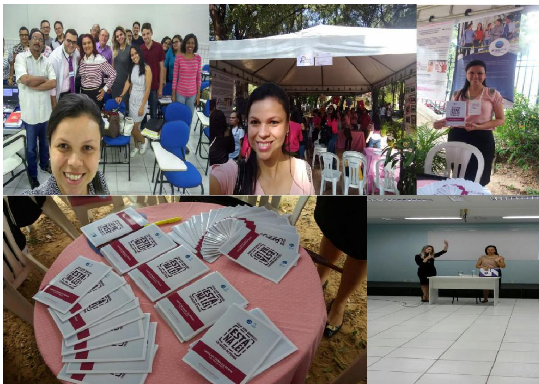
Figura 1: Alunos em atividades de responsabilidade social junto à comunidade local.