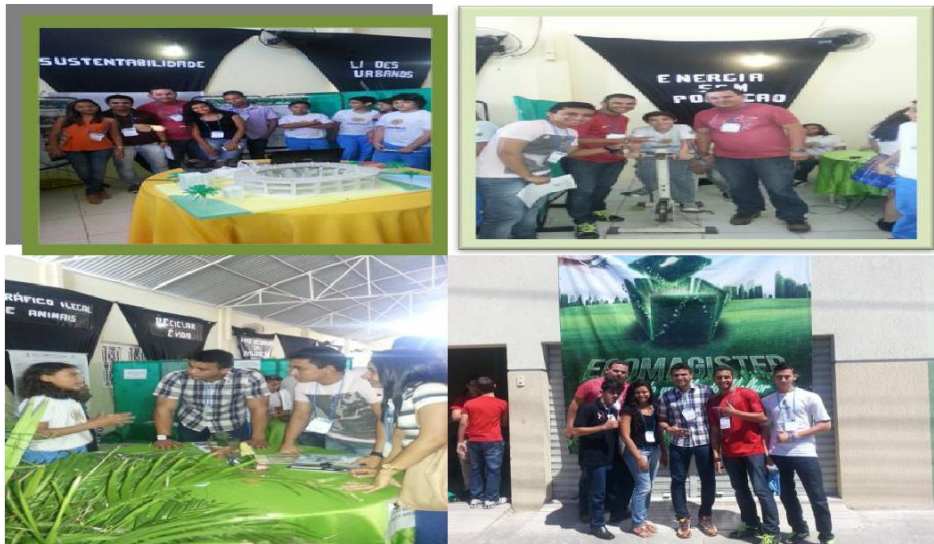
Figura 4: Responsabilidade Social.