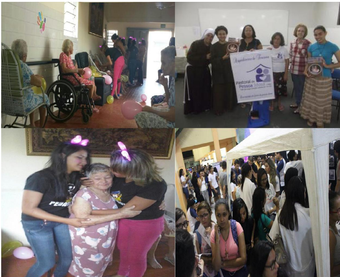
Figuras 5: Sociedade e alunos. Atividades de Responsabilidade Social.