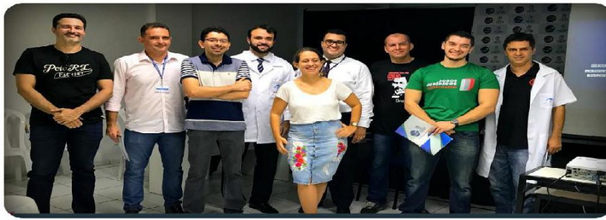
Figura 3: Ação de Responsabilidade Social.